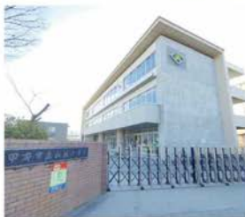
市立山城小学校 徒歩約12分 (約890～950m)