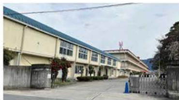
市立山梨北中学校 徒歩約11分(約860m)