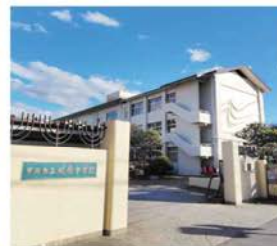
市立城南中学校 徒歩約23～24分 (約1,800～1,860m)