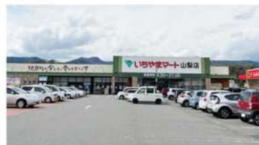
いちやまmart山梨店 徒歩約13分(約1,000m)