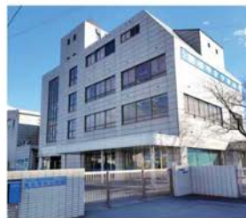
私立駿台甲府小学校 徒歩約11～12分 (約830～890m)