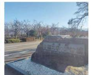
小瀬スポーツ公園 徒歩約6～7分 (約450～510m)

※記載の距離は地図上に基に算出した概算距離です。※徒歩分数は1分/80mで計算しております。端数は繰り上げております。