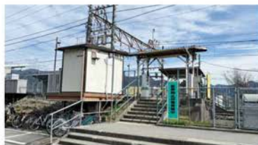
JR中央線「東山梨」駅 徒歩約12分(約890m)

※記載の距離は地図上を基に算出した概算距離です。※徒歩分は1分/80mで計算しております。端数は繰り上げております。