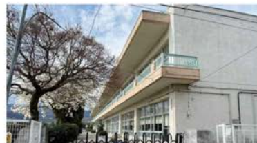
市立日下部小学校 徒歩約9分(約720m)