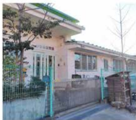
かほる保育園 徒歩約15～16分 (約1,200～1,260m)